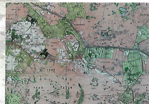
Orvelte e.o. ca 1900

In de 19e eeuw bestond Drenthe voor bijna 70% uit heide. Bos was er vrijwel niet meer. De beekdalen waren kleddernat en vaak alleen geschikt als hooiland. Rundvee graasde op de hogere delen van het beekdal. Houtwallen hielden het vee in de weilanden. Rond de dorpen lagen de akkers, de zogenaamde essen. Hierop verbouwden de boeren granen als winterrogge, maar ook aardappels en voederbieten. Schaapskuddes en rundvee zwierven met hun herders over de heide. Eeuwenlang werden de akkers met schapenpoep uit de stal en met heideplaggen bemest. De bodems onder de essen, de stuifzanden en de oude houtwallen getuigen van deze geschiedenis. Toen de kunstmest zijn intrede deed, waren de schapen niet meer nodig. De heidevelden werden vanaf het einde van de 19e eeuw in rap tempo ontgonnen tot akkers, weilanden of bos. Rond Orvelte is het Reijntjesveld gelukkig overgebleven. Rond 1950 kwamen de ruilverkavelingen. Grote machines deden hun intrede. De landbouw werd grootschaliger, veel houtwallen en singels verdwenen. De natte beekdalen werden droger.